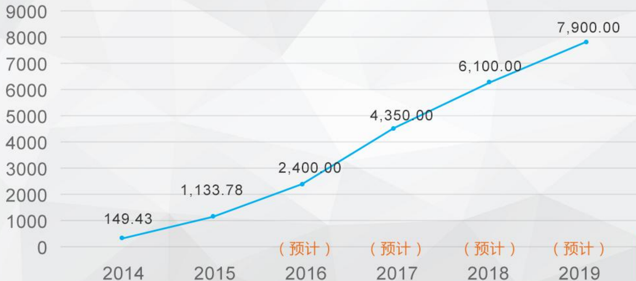
盈利预测 — 利润 (单位: 万元)