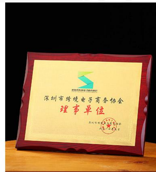
2014成为深圳市跨境商务协会理事单位