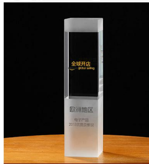
2015Amazon欧洲地区电子产品“2015优质卖家奖”