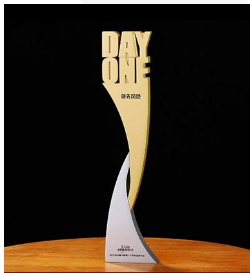
2013亚马逊中国第三方卖家大会“领先风范奖”

四年不断前行，成长和荣誉始终伴随着帕拓逊。迄今为止，公司已拥有50多项专利技术，并先后获得2013年亚马逊中国第三方卖家大会“领先风范奖”，2014年Ebay优秀卖家奖，2015年Amazon欧洲地区电子产品“2015优质卖家奖”等荣誉，并于2014年成为深圳市跨境商务协会理事单位。