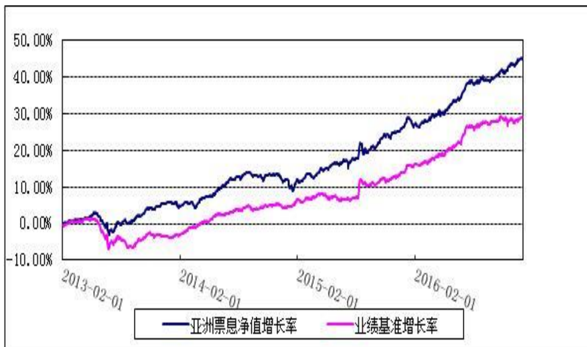
博时亚洲票息收益债券型证券投资基金 份额累计净值增长率与业绩比较基准收益率历史走势对比图 (2013年2月1日至2016年12月31日)

注：本基金的基金合同于 2013 年 2 月 1 日生效，按照本基金的基金合同规定，自基金合同生效之日起六个月内使基金的投资组合比例符合本基金合同第 12 条“三、投资范围”、“五、投资限制”的