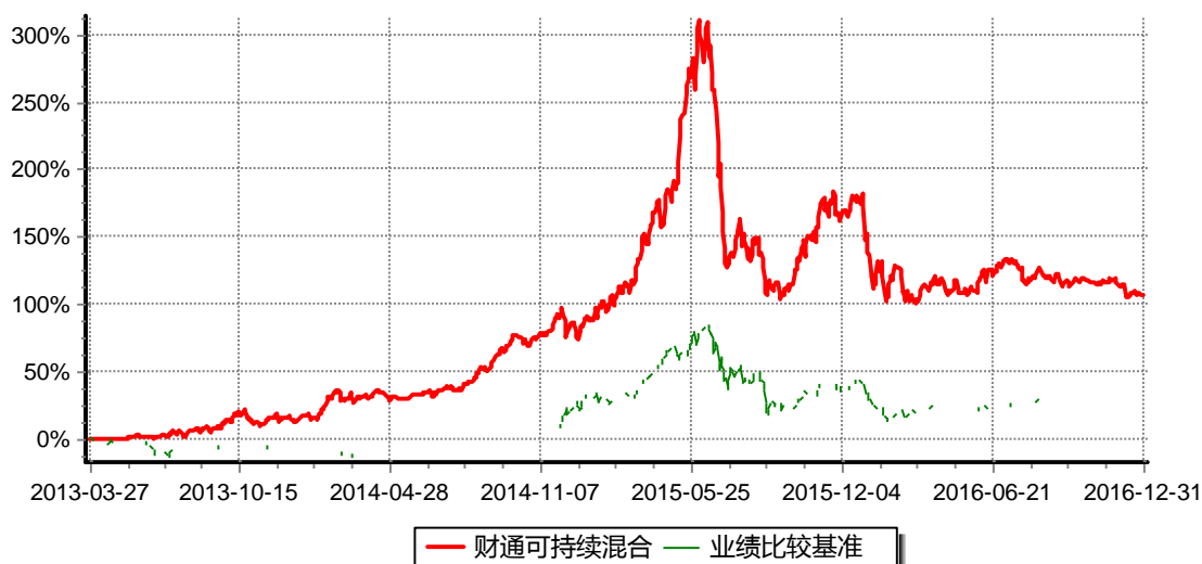
财通可持续发展主题混合型证券投资基金 累计净值增长率与业绩比较基准收益率历史走势对比图 (2013年3月27日-2016年12月31日)