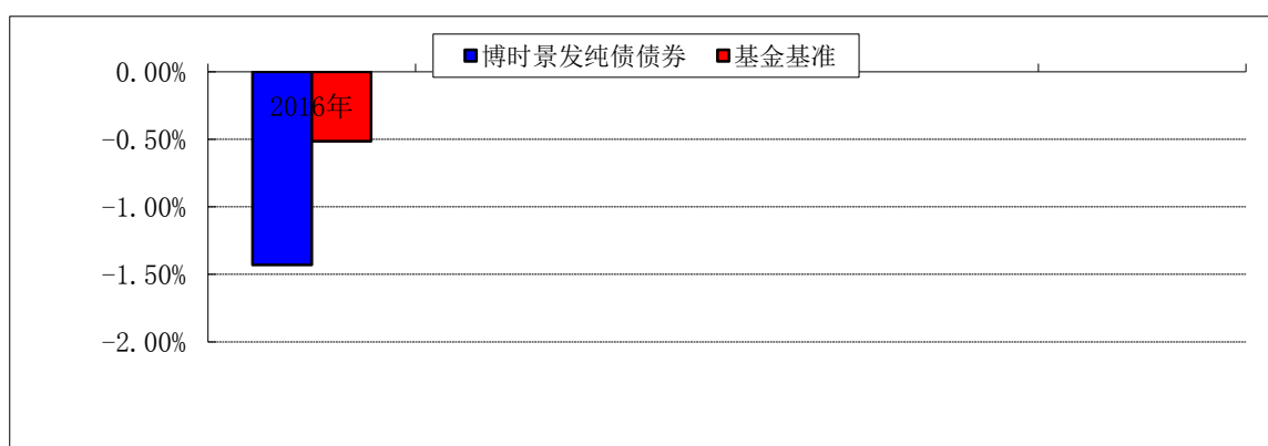
自基金合同生效以来基金净值增长率与业绩比较基准收益率的对比图