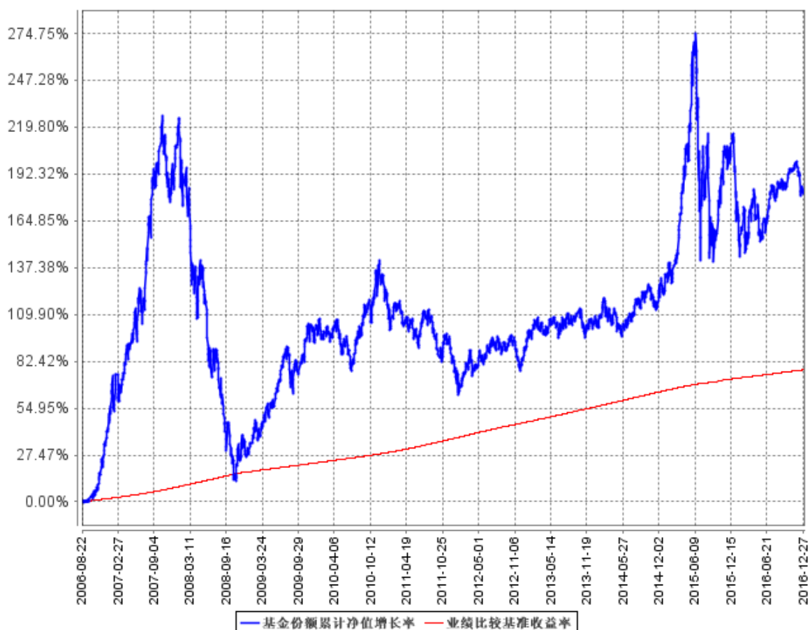
基金份额累计净值增长率与同期业绩比较基准收益率的历史走势对比图

注：本基金合同规定本基金投资组合为：股票投资比例为基金净资产的 10%—85%；权证投资比例为基金净资产的 0%—3%；债券投资比例为基金净资产的 10%—85%；现金或者到期日在一年以内的政府债券为基金净资产的 5%以上。本基金的建仓期为自本基金基金合同生效日起 6 个月，建仓期满时，各项资产配置比例符合基金合同约定。