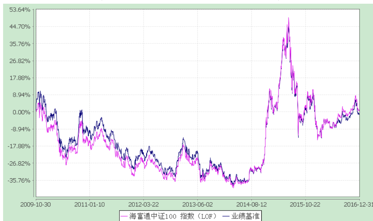
海富通中证 100 指数证券投资基金 (LOF) 份额累计净值增长率与业绩比较基准收益率的历史走势对比图 (2009 年 10 月 30 日至 2016 年 12 月 31 日)

注：按照本基金合同规定，本基金建仓期为基金合同生效之日起六个月。建仓期满至今，本基金投资组合均达到本基金合同第十五条（二）、（七）规定的比例限制及本基金投资组合的比例范围。