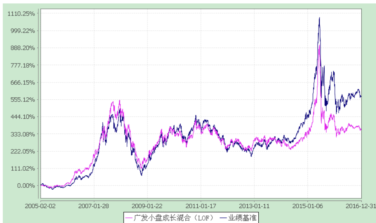
广发小盘成长混合型证券投资基金（LOF） 份额累计净值增长率与业绩比较基准收益率的历史走势对比图 (2005年2月2日至2016年12月31日)