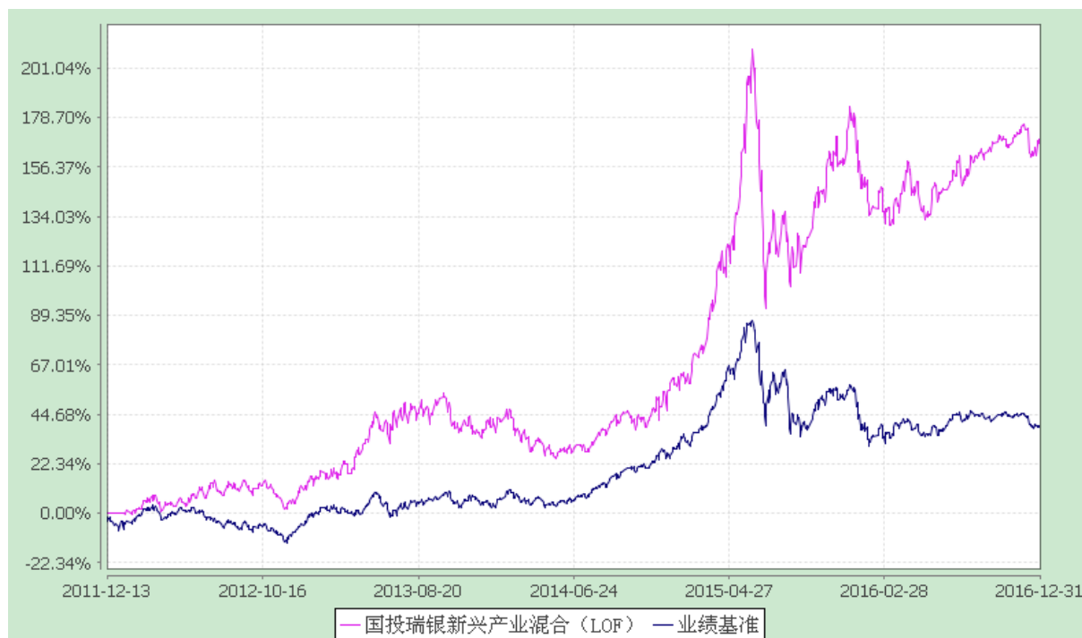
国投瑞银新兴产业混合型证券投资基金(LOF) 份额累计净值增长率与业绩比较基准收益率的历史走势对比图 (2011 年 12 月 13 日至 2016 年 12 月 31 日)

注：本基金建仓期为自基金合同生效日起的 6 个月。截至建仓期结束，本基金各项资产配置比例符合基金合同及招募说明书有关投资比例的约定。