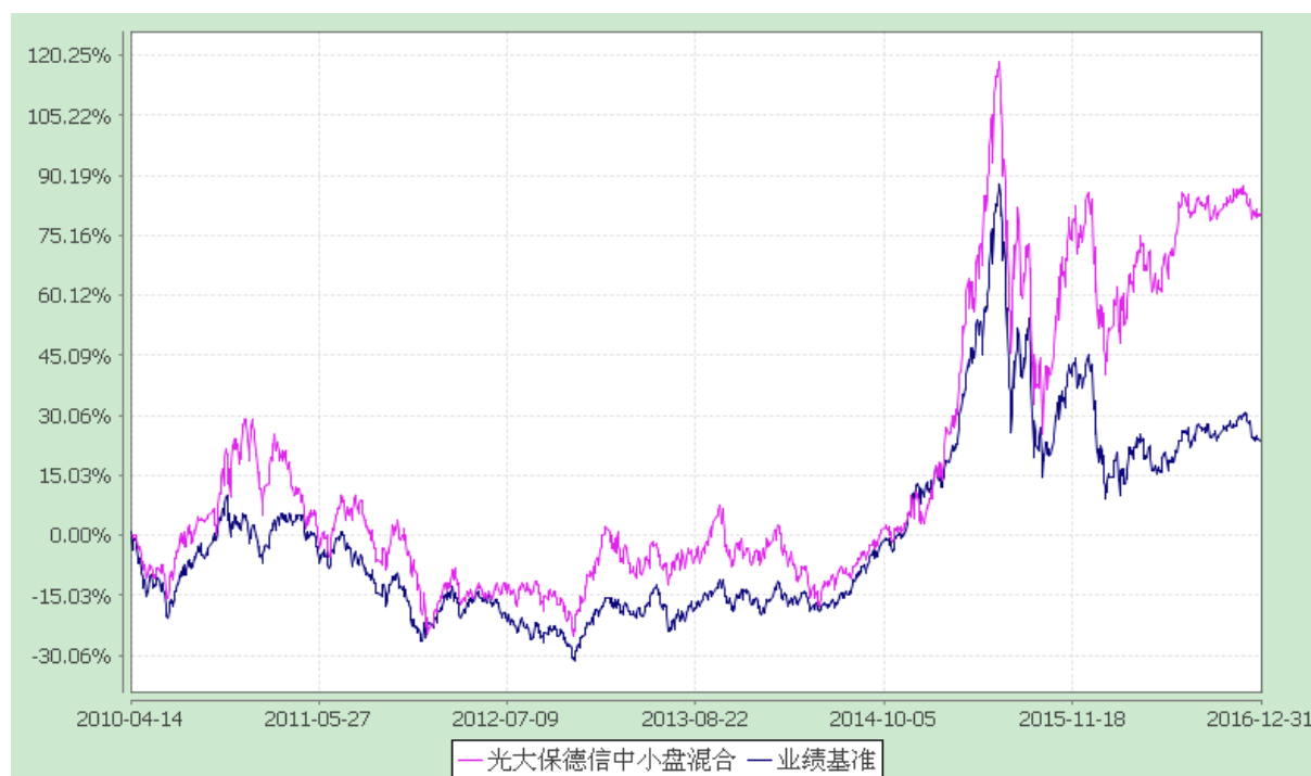
光大保德信中小盘混合型证券投资基金 份额累计净值增长率与业绩比较基准收益率的历史走势对比图 (2010 年 4 月 14 日至 2016 年 12 月 31 日)

注：根据基金合同的规定，本基金建仓期为 2010 年 4 月 14 日至 2010 年 10 月 13 日。建仓期结