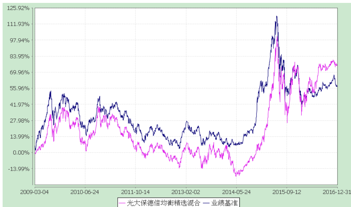
光大保德信均衡精选混合型证券投资基金 份额累计净值增长率与业绩比较基准收益率的历史走势对比图 (2009 年 3 月 4 日至 2016 年 12 月 31 日)

注：根据基金合同的规定，本基金建仓期为 2009 年 3 月 4 日至 2009 年 9 月 3 日。建仓期结束时本基金各项资产配置比例符合本基金合同规定的比例限制及投资组合的比例范围。