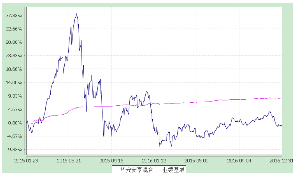
华安安享灵活配置混合型证券投资基金 份额累计净值增长率与业绩比较基准收益率的历史走势对比图 (2015 年 1 月 23 日至 2016 年 12 月 31 日)