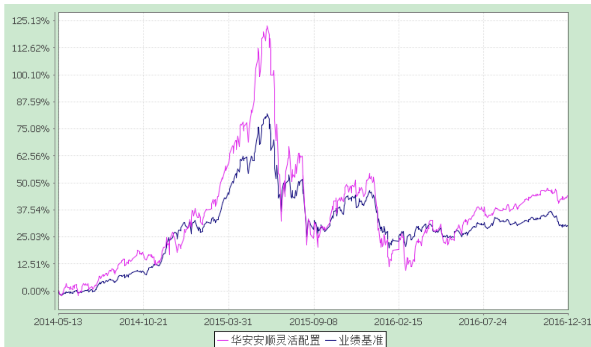
华安安顺灵活配置混合型证券投资基金 份额累计净值增长率与业绩比较基准收益率的历史走势对比图 (2014 年 5 月 12 日至 2016 年 12 月 31 日)