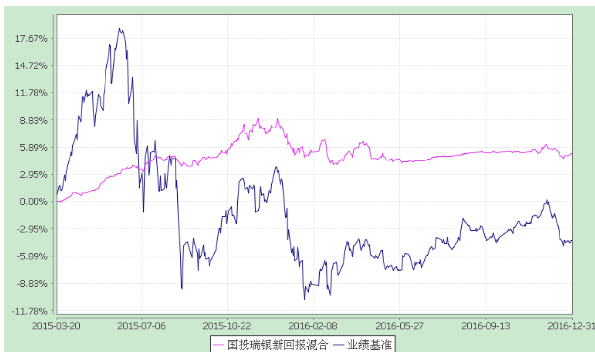
国投瑞银新回报灵活配置混合型证券投资基金 份额累计净值增长率与业绩比较基准收益率的历史走势对比图 (2015 年 3 月 20 日至 2016 年 12 月 31 日)

注：本基金建仓期为自基金合同生效日起的六个月。截至建仓期结束，本基金各项资产配置比例符合基金合同及招募说明书有关投资比例的约定。