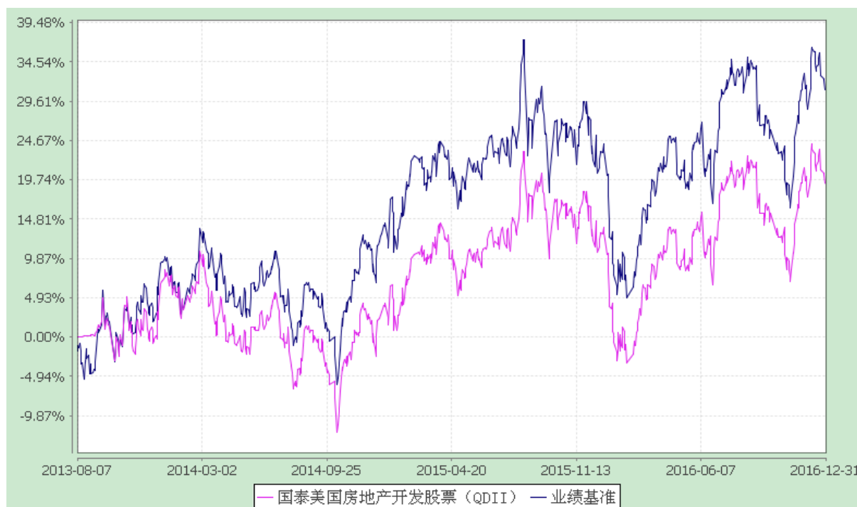
国泰美国房地产开发股票型证券投资基金 自基金合同生效以来份额累计净值增长率与业绩比较基准收益率历史走势对比图 (2013 年 8 月 7 日至 2016 年 12 月 31 日)

注：（1）本基金的合同生效日为 2013 年 8 月 7 日，本基金在六个月建仓期结束时，各项资产配置比例符合合同约定；