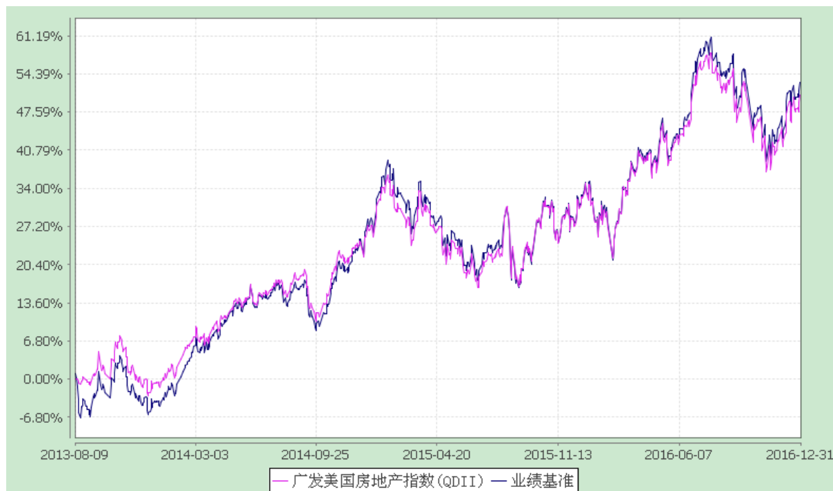
广发美国房地产指数证券投资基金 份额累计净值增长率与业绩比较基准收益率历史走势对比图 (2013 年 8 月 9 日至 2016 年 12 月 31 日)