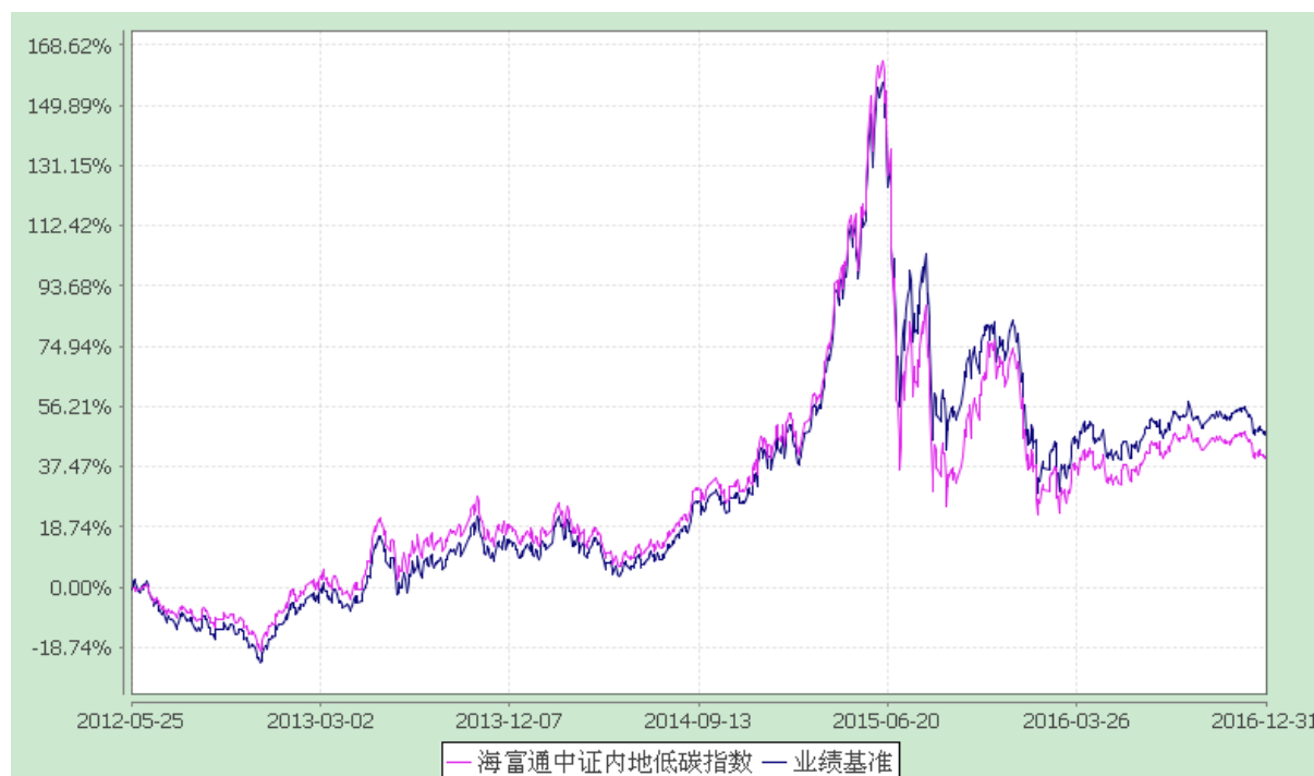
海富通中证内地低碳经济主题指数证券投资基金 份额累计净值增长率与业绩比较基准收益率的历史走势对比图 (2012年5月25日至2016年12月31日)

注：按照本基金合同规定，本基金建仓期为基金合同生效之日起六个月。截至报告期末本基金的各项投资比例已达到基金合同第十二部分（二）投资范围、（六）投资限制中规定的各项比例。