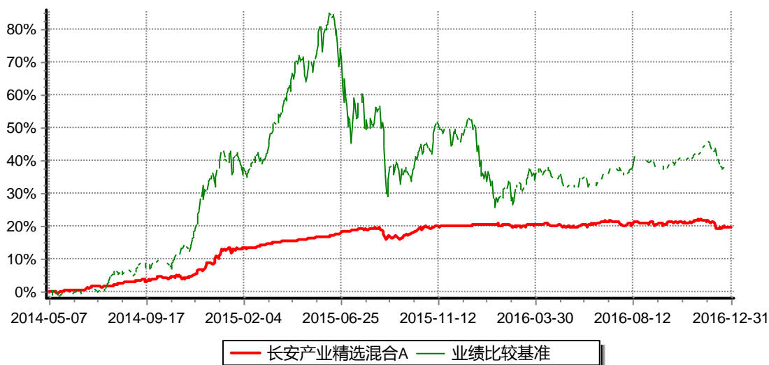
长安产业精选混合A份额累计净值增长率与同期业绩比较基准收益率的历史走势对比图

注：本基金合同生效日为2014年5月7日，基金合同生效日至报告期期末，本基金运作时间超过一年。根据基金合同的规定，自基金合同生效之日起6个月内基金各项资产配置比例需符合基金合同要求。本基金在建仓期结束后，各项资产配置比例已符合基金合同有关投资比例的约定。图示日期为2014年5月7日至2016年12月31日。