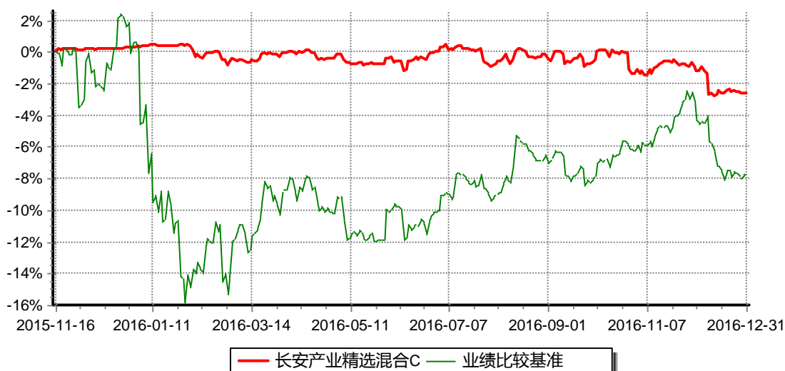
长安产业精选混合C份额累计净值增长率与同期业绩比较基准收益率的历史走势对比图

注：本基金C类份额生效日为2015年11月16日，自本基金C类份额生效日至报告期期末，运作时间超过一年。根据基金合同的规定，自基金合同生效之日起6个月内基金各项资产配置比例需符合基金合同要求。本基金在建仓期结束后，各项资产配置比例已符合基金合同有关投资比例的约定。图示日期为2015年11月16日至2016年12月31日。