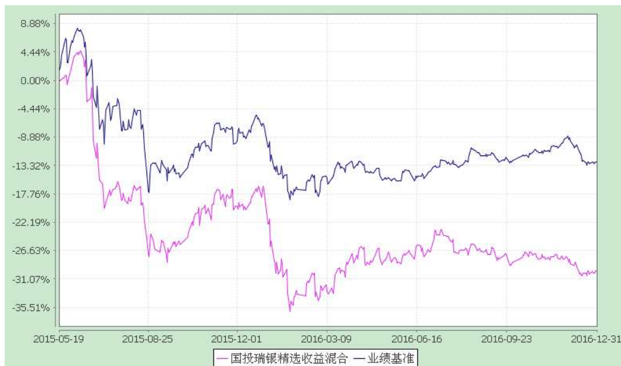
份额累计净值增长率与业绩比较基准收益率的历史走势对比图 (2015 年 5 月 19 日至 2016 年 12 月 31 日)

注：本基金建仓期为自基金合同生效日起的 6 个月。截至建仓期结束，本基金各项资产配置比例符合基金合同及招募说明书有关投资比例的约定。