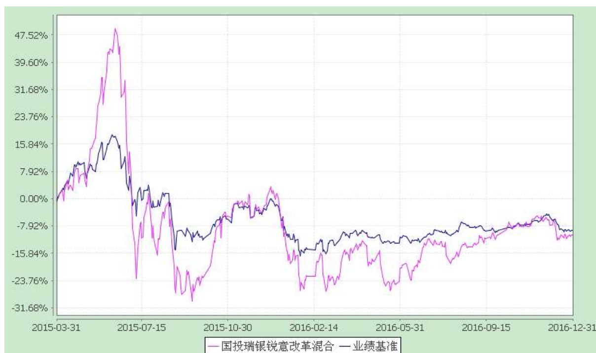
国投瑞银锐意改革灵活配置混合型证券投资基金 份额累计净值增长率与业绩比较基准收益率的历史走势对比图 (2015 年 3 月 31 日至 2016 年 12 月 31 日)

注：本基金建仓期为自基金合同生效日起的六个月。截至本报告期末，本基金各项资产配置比例符合基金合同及招募说明书有关投资比例的约定。