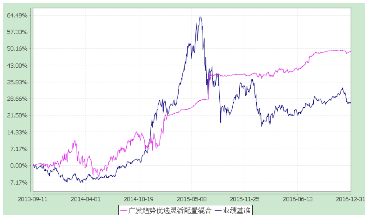
广发趋势优选灵活配置混合型证券投资基金 份额累计净值增长率与业绩比较基准收益率的历史走势对比图 (2013 年 9 月 11 日至 2016 年 12 月 31 日)