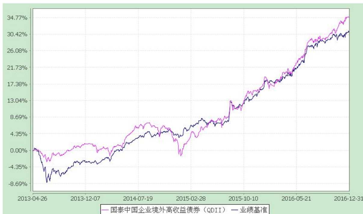
国泰中国企业境外高收益债券型证券投资基金 自基金合同生效以来份额累计净值增长率与业绩比较基准收益率历史走势对比图 (2013 年 4 月 26 日至 2016 年 12 月 31 日)

注：（1）本基金的合同生效日为 2013 年 4 月 26 日。本基金在六个月建仓期结束时，各项资产配置比例符合合同约定。