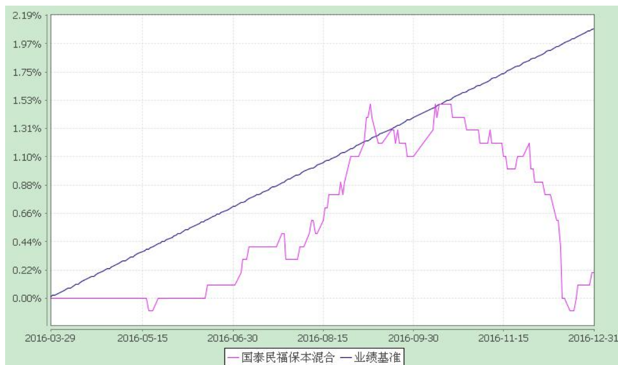
自基金合同生效以来份额累计净值增长率与业绩比较基准收益率的历史走势对比图 (2016 年 3 月 29 日至 2016 年 12 月 31 日)

注：1、本基金的合同生效日为 2016 年 3 月 29 日。截止至 2016 年 12 月 31 日，本基金运作时间未满一年。