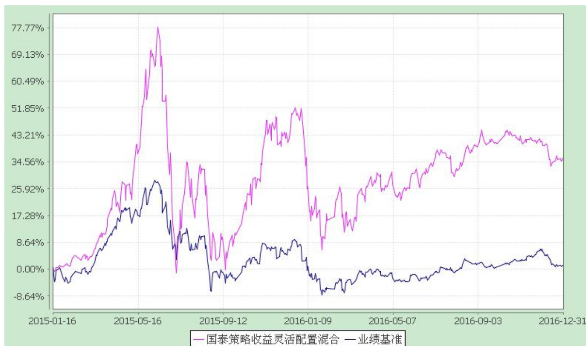
自基金转型以来份额累计净值增长率与业绩比较基准收益率的历史走势对比图 (2015 年 1 月 16 日至 2016 年 12 月 31 日)

注：本基金合同生效日为 2015 年 1 月 16 日，本基金在 3 个月建仓期结束时，各项资产配置比例符合合同约定。