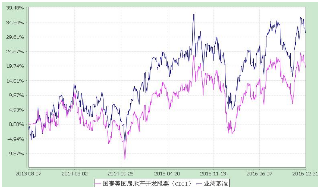
国泰美国房地产开发股票型证券投资基金 自基金合同生效以来份额累计净值增长率与业绩比较基准收益率历史走势对比图 (2013 年 8 月 7 日至 2016 年 12 月 31 日)

注：（1）本基金合同生效日为 2013 年 8 月 7 日，本基金在六个月建仓期结束时，各项资产配置比例符合合同约定；