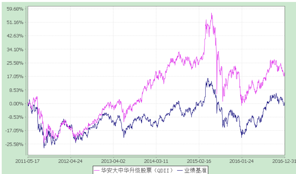
华安大中华升级股票型证券投资基金 自基金合同生效以来份额累计净值增长率与业绩比较基准收益率历史走势对比图 (2011 年 5 月 17 日至 2016 年 12 月 31 日)

注：根据《华安大中华升级股票型证券投资基金基金合同》规定，本基金建仓期不超过 6 个月。截至本报告期末，本基金的投资组合比例已符合基金合同第十四部分“基金的投资”中投资范围、投资限制的有关约定。