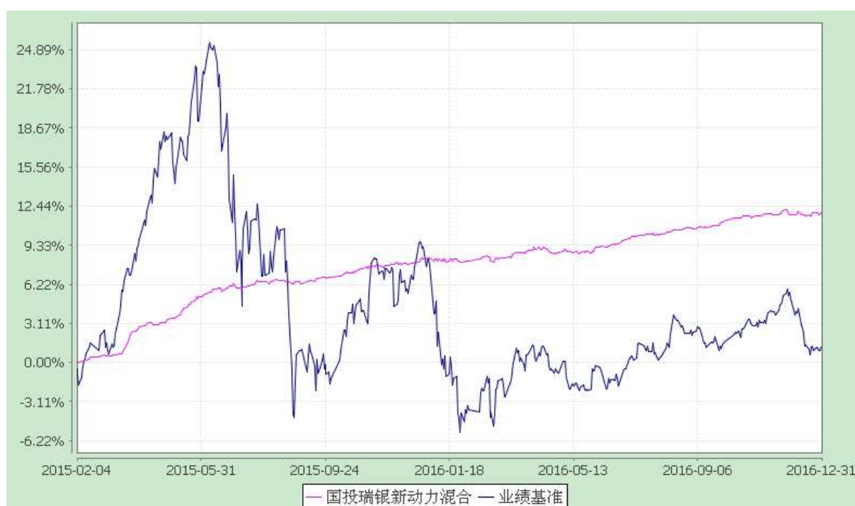
国投瑞银新动力灵活配置混合型证券投资基金 份额累计净值增长率与业绩比较基准收益率的历史走势对比图 (2015 年 2 月 4 日至 2016 年 12 月 31 日)

注：本基金建仓期为自基金合同生效日起的六个月。截至建仓期结束，本基金各项资产配置比例符合基金合同及招募说明书有关投资比例的约定。