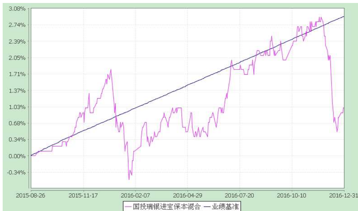
国投瑞银进宝保本混合型证券投资基金 份额累计净值增长率与业绩比较基准收益率的历史走势对比图 (2015 年 8 月 26 日至 2016 年 12 月 31 日)

注：本基金建仓期为自基金合同生效日起的六个月。截至本报告期末，本基金各项资产配置比例符合基金合同及招募说明书有关投资比例的约定。