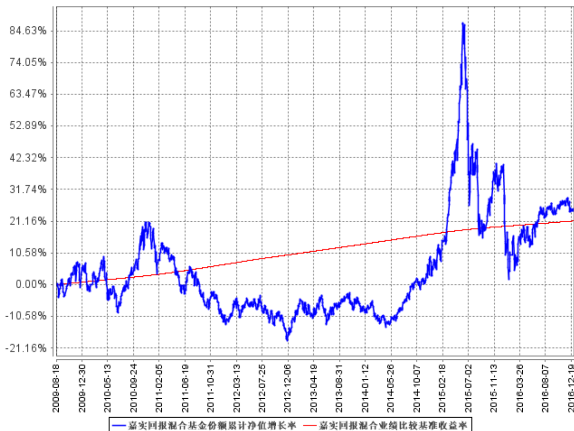
图：嘉实回报混合基金份额累计净值增长率与同期业绩比较基准收益率的历史走势对比图