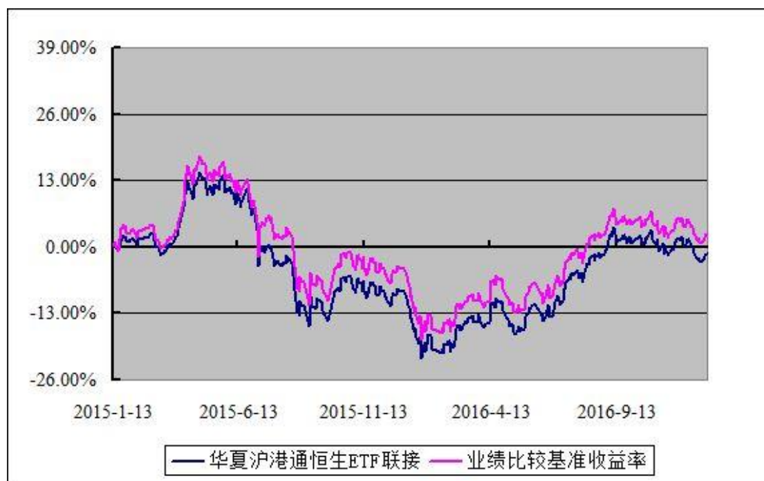
华夏沪港通恒生交易型开放式指数证券投资基金联接基金 份额累计净值增长率与业绩比较基准收益率历史走势对比图 (2015年1月13日至2016年12月31日)