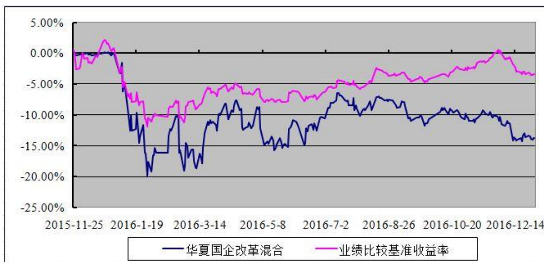
华夏国企改革灵活配置混合型证券投资基金 份额累计净值增长率与业绩比较基准收益率历史走势对比图 (2015 年 11 月 25 日至 2016 年 12 月 31 日)

注：根据华夏国企改革灵活配置混合型证券投资基金的基金合同规定，本基金自基金合同生效之日起 6 个月内使基金的投资组合比例符合本基金合同第十二部分“二、投资范围”、“四、投资限制”的有关约定。