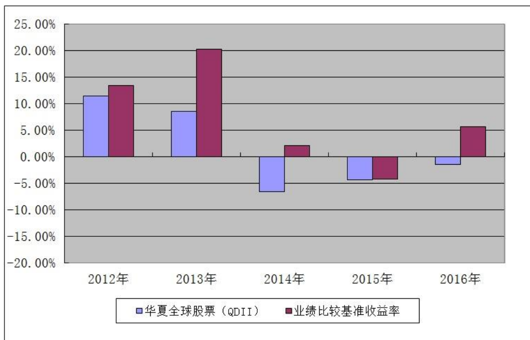
过去五年基金每年净值增长率及其与同期业绩比较基准收益率的对比图