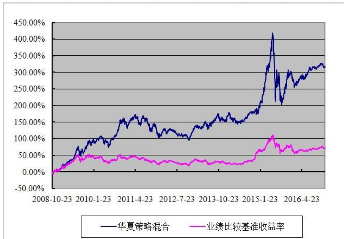
华夏策略精选灵活配置混合型证券投资基金 份额累计净值增长率与业绩比较基准收益率历史走势对比图 (2008年10月23日至2016年12月31日)