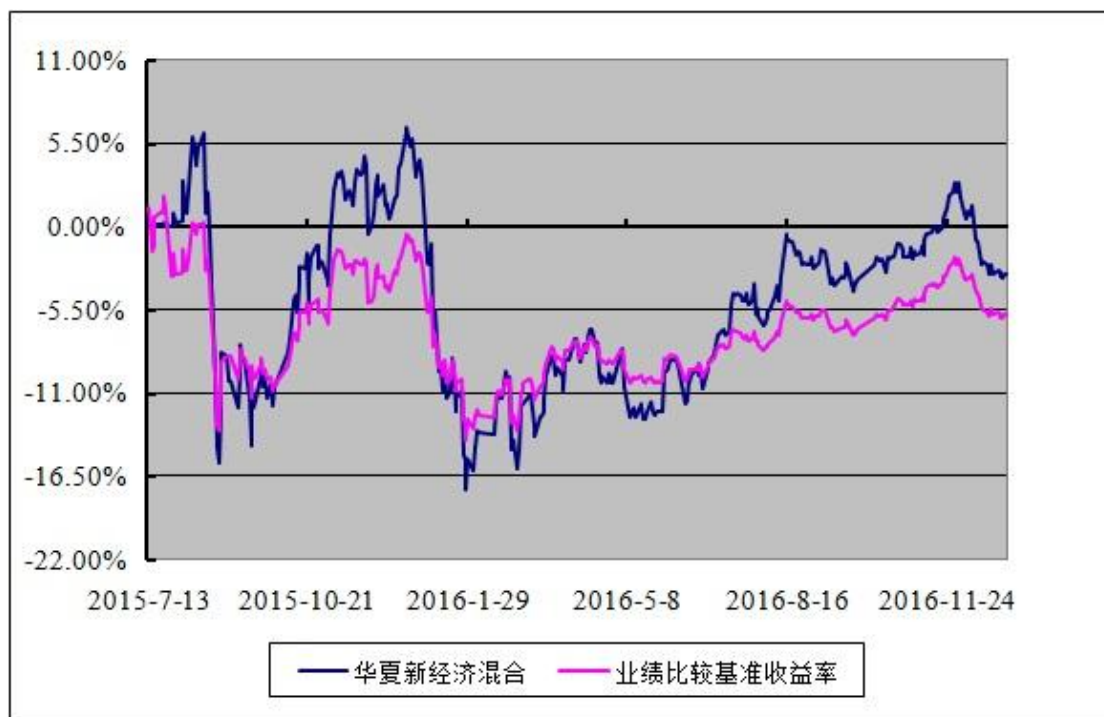
华夏新经济灵活配置混合型发起式证券投资基金 份额累计净值增长率与业绩比较基准收益率历史走势对比图 (2015 年 7 月 13 日至 2016 年 12 月 31 日)

注：根据华夏新经济灵活配置混合型发起式证券投资基金的基金合同规定，本基金自基金合同生效之日起 6 个月内使基金的投资组合比例符合本基金合同第十二部分“二、投资范围”、“四、投资限制”的有关约定。