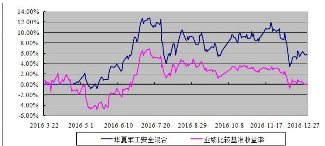
华夏军工安全灵活配置混合型证券投资基金 份额累计净值增长率与业绩比较基准收益率历史走势对比图 (2016 年 3 月 22 日至 2016 年 12 月 31 日)