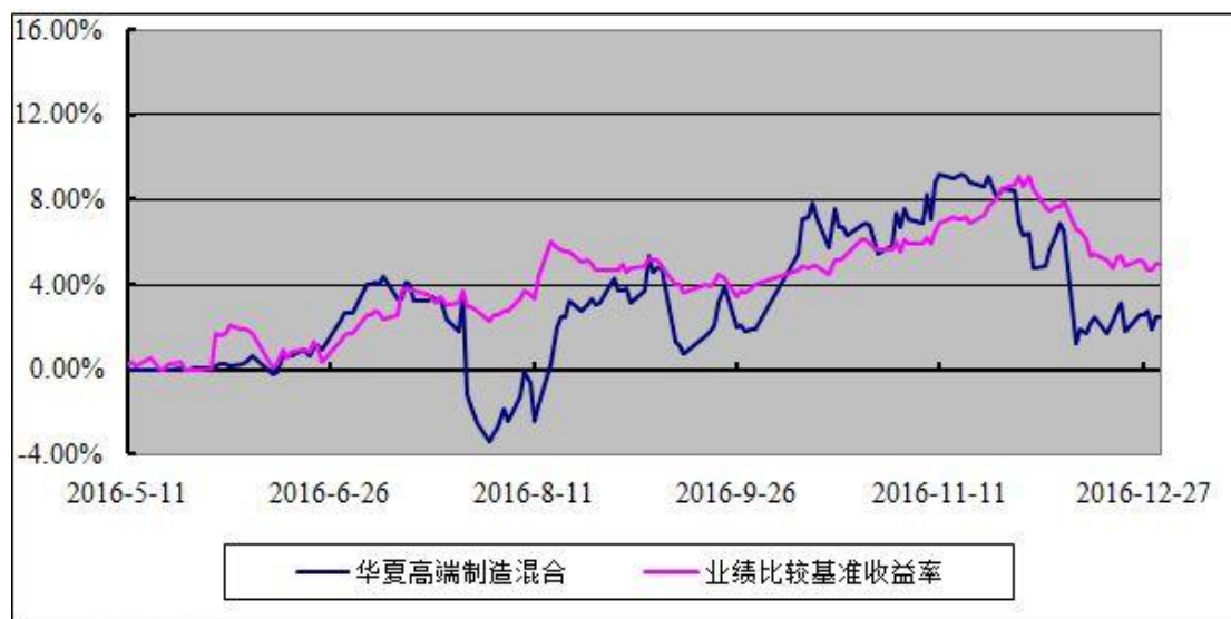
华夏高端制造灵活配置混合型证券投资基金 份额累计净值增长率与业绩比较基准收益率历史走势对比图 (2016 年 5 月 11 日至 2016 年 12 月 31 日)