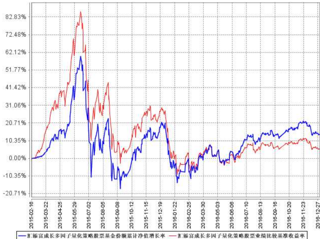
汇添富成长多因子量化策略股票基金份额累计净值增长率与同期业绩比较基准收益率的历史走势对比图