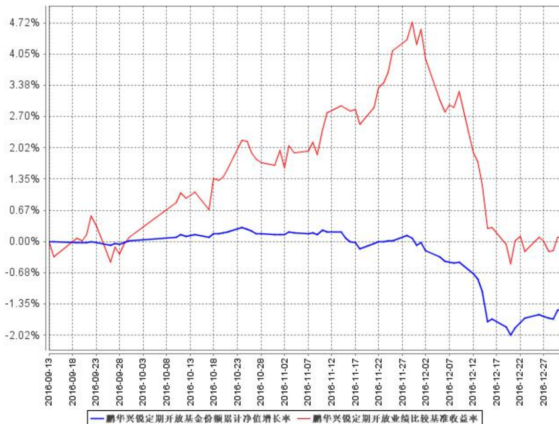
鹏华兴锐定期开放基金份额累计净值增长率与同期业绩比较基准收益率的历史走势对比图

注：1、本基金基金合同于 2016 年 9 月 13 日生效，截至本报告期末本基金基金合同生效未满一年。 2、本基金管理人将严格按照本基金合同的约定，于本基金建仓期届满后确保各项投资比例符合基金合同的约定。