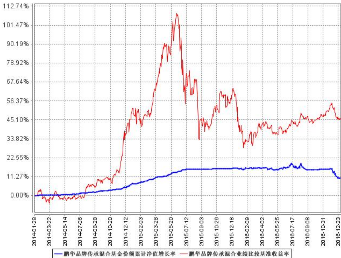
鹏华品牌传承混合基金份额累计净值增长率与同期业绩比较基准收益率的历史走势对比图