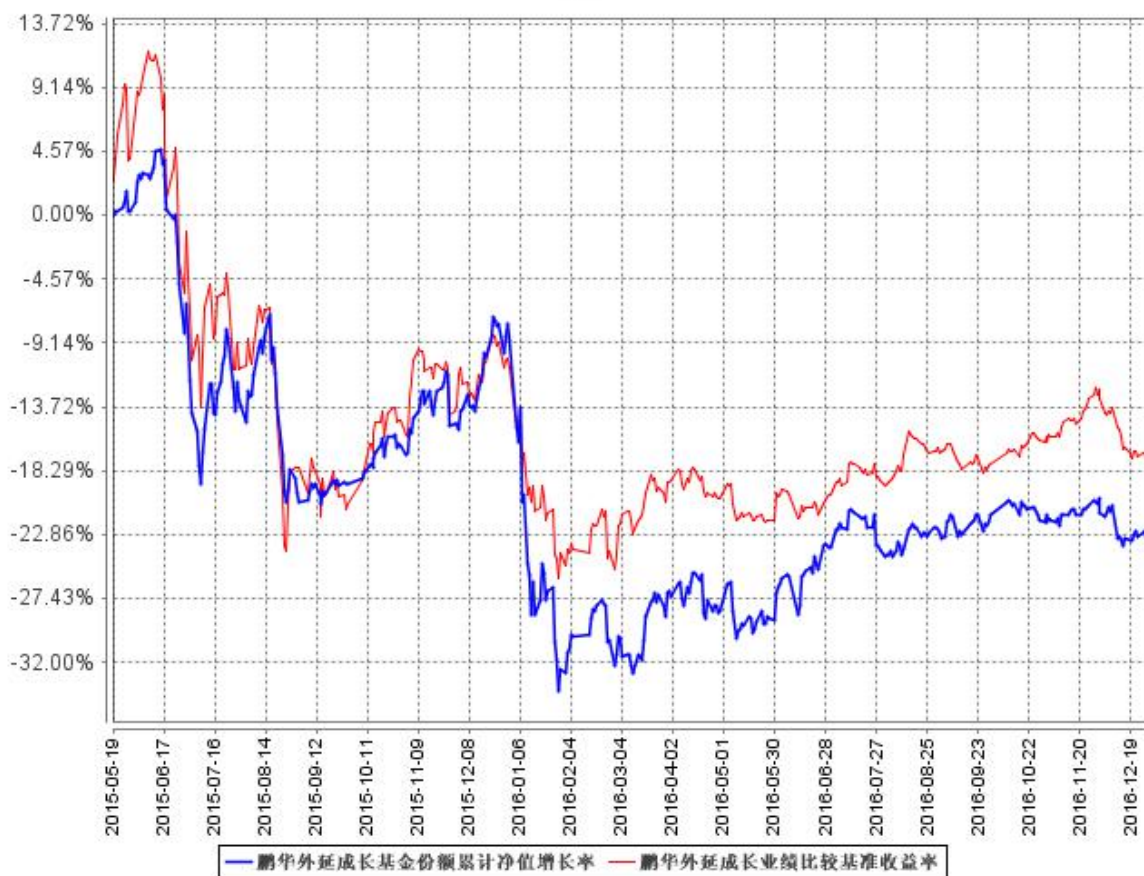
鹏华外延成长基金份额累计净值增长率与同期业绩比较基准收益率的历史走势对比图