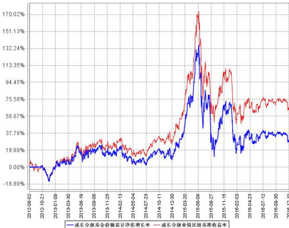
成长分级基金份额累计净值增长率与同期业绩比较基准收益率的历史走势对比图