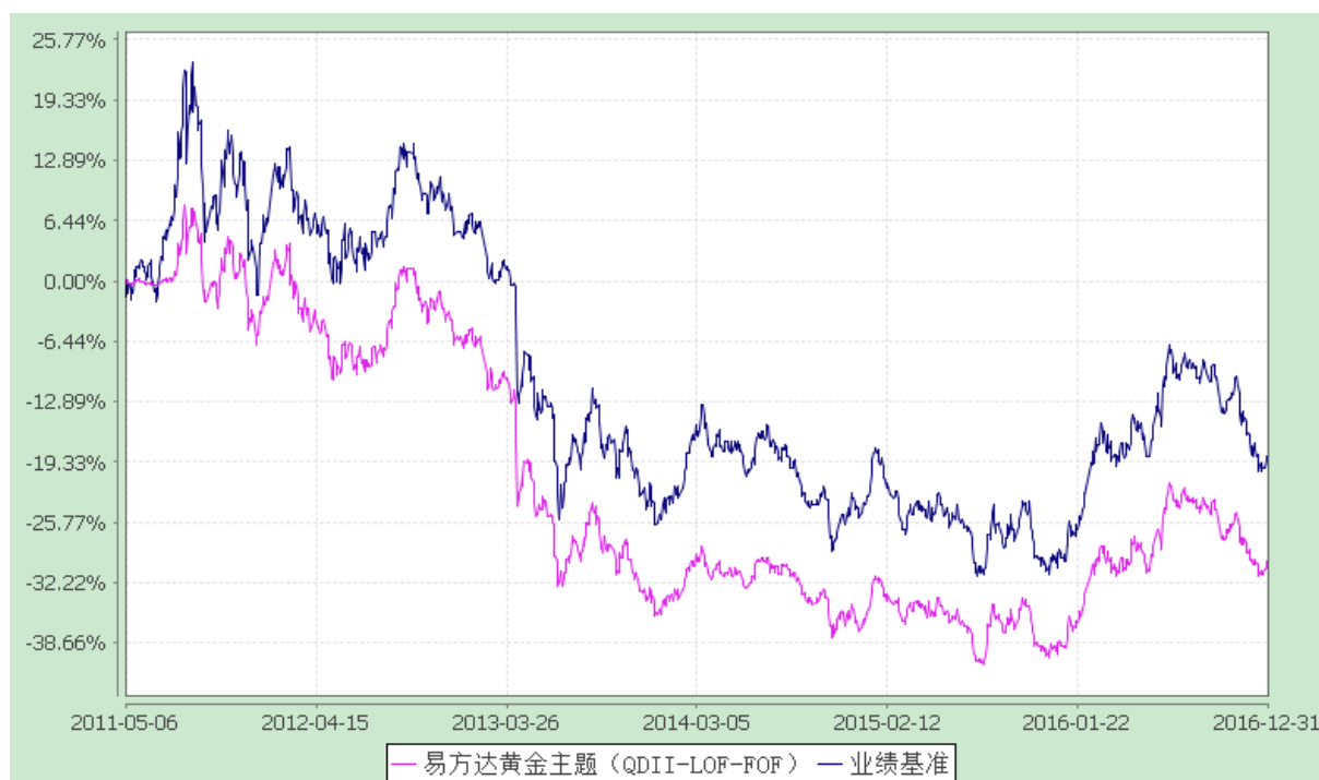
易方达黄金主题证券投资基金（LOF） 份额累计净值增长率与业绩比较基准收益率历史走势对比图 （2011年5月6日至2016年12月31日）