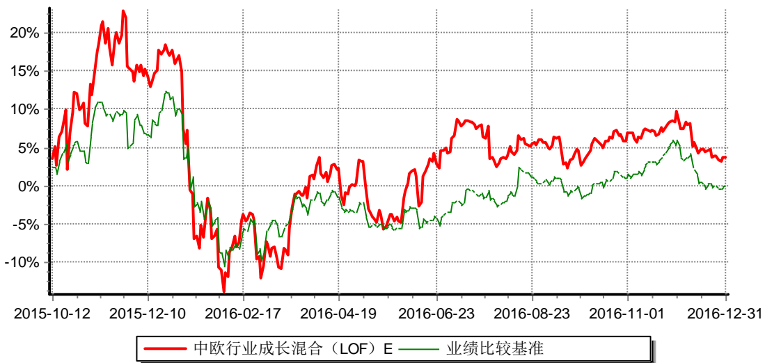
累计净值增长率与业绩比较基准收益率历史走势对比图 (2015年10月12日-2016年12月31日)

注：本基金于2015年10月8日新增E份额，图示日期为2015年10月12日至2016年12月31日。