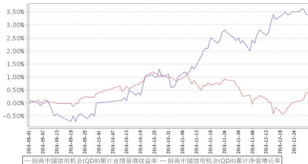
招商中国信用机会(QDII)累计净值增长率与同期业绩比较基准收益率的历史走势对比图

注：本基金合同于2016年9月2日生效，截至本报告期末基金成立未满一年；自基金成立日起6个月内为建仓期，截至报告期末基金尚未完成建仓。