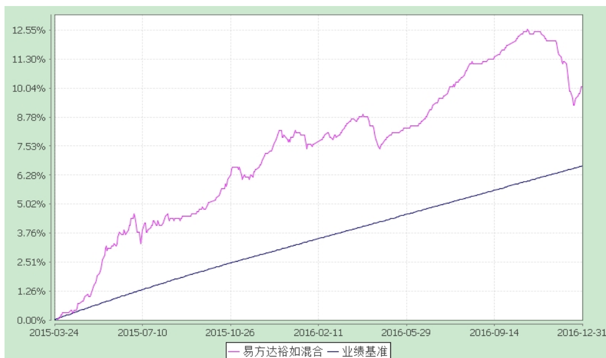
易方达裕如灵活配置混合型证券投资基金 份额累计净值增长率与业绩比较基准收益率历史走势对比图 (2015年3月24日至2016年12月31日)

注：自基金合同生效至报告期末，基金份额净值增长率为 10.10%，同期业绩比较基准收益率为 6.67%。