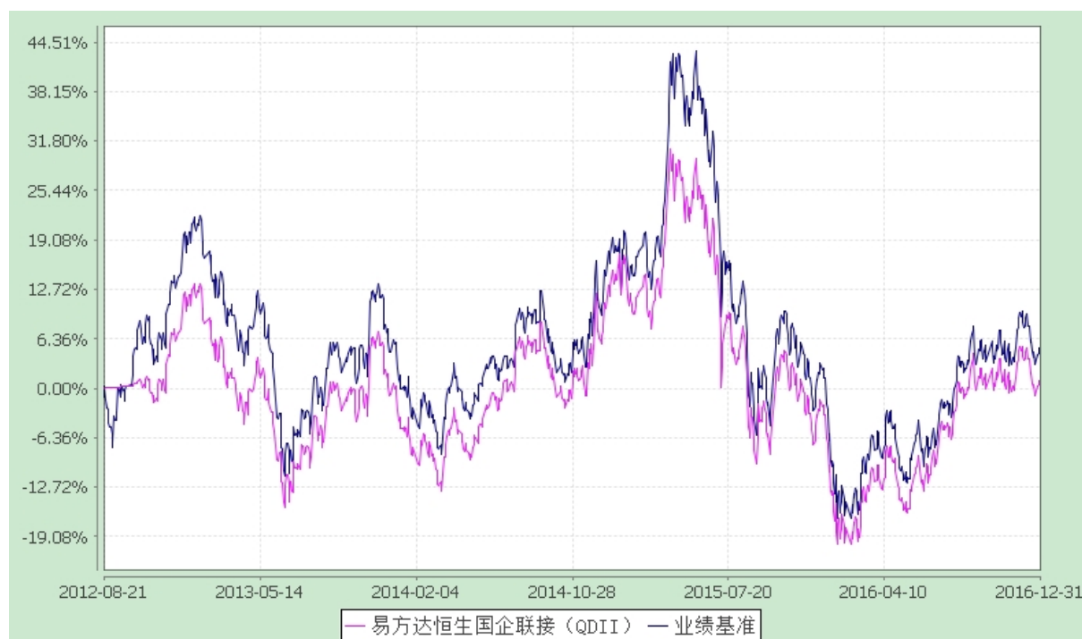
易方达恒生中国企业交易型开放式指数证券投资基金联接基金 份额累计净值增长率与业绩比较基准收益率历史走势对比图 (2012年8月21日至2016年12月31日)