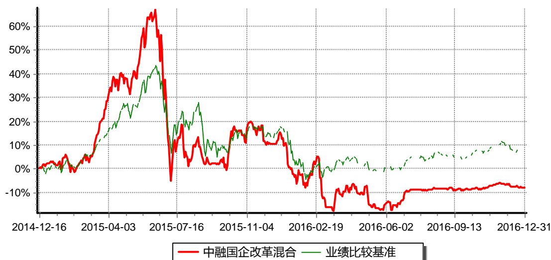
图：中融国企改革灵活配置混合型证券投资基金份额累计净值增长率与同期业绩比较基准收益率历史走势对比图