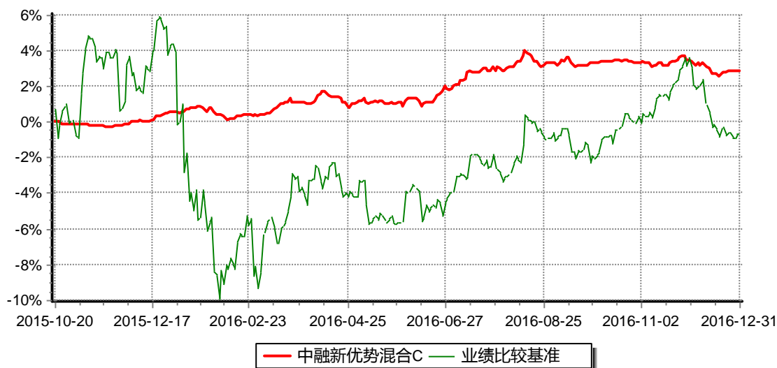
图：中融新优势混合C累计净值增长率与同期业绩比较基准收益率的历史走势对比图（2015年10月20日至2016年12月31日）

注：按照合同和招募说明书的约定，本基金自合同生效日起6个月内为建仓期，建仓期结束时本基金的各项资产配置比例符合基金合同的有关约定。