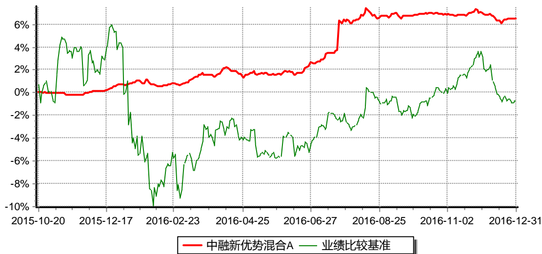
图：中融新优势混合A累计净值增长率与同期业绩比较基准收益率的历史走势对比图（2015年10月20日至2016年12月31日）