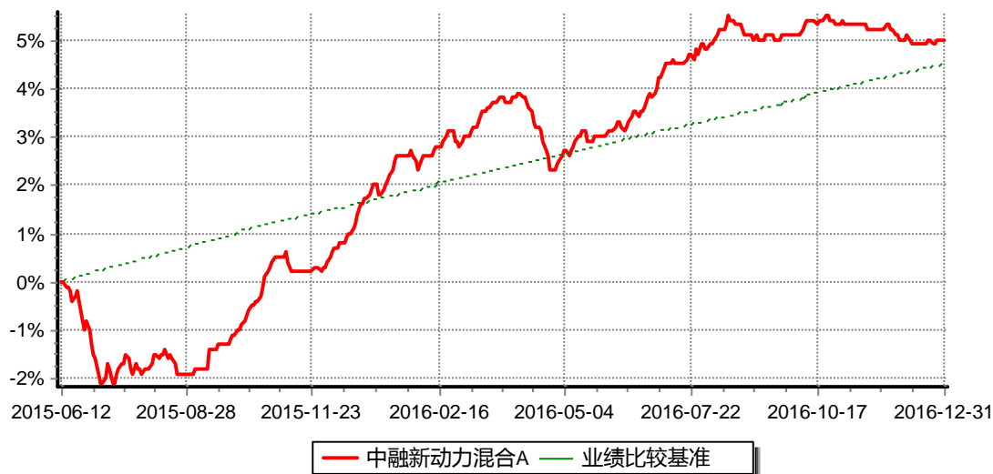
图:中融新动力混合A份额累计净值增长率与同期业绩比较基准收益率的历史走势对比图 (2015年6月12日至2016年12月31日)