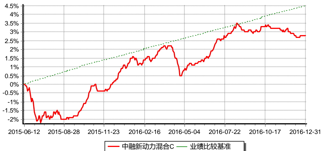
图:中融新动力混合C份额累计净值增长率与同期业绩比较基准收益率的历史走势对比图 (2015年6月12日至2016年12月31日)

注:按基金合同和招募说明书的约定,本基金自基金合同生效日起6个月内为建仓期,建仓期结束时本基金的各项资产配置比例符合基金合同的有关约定