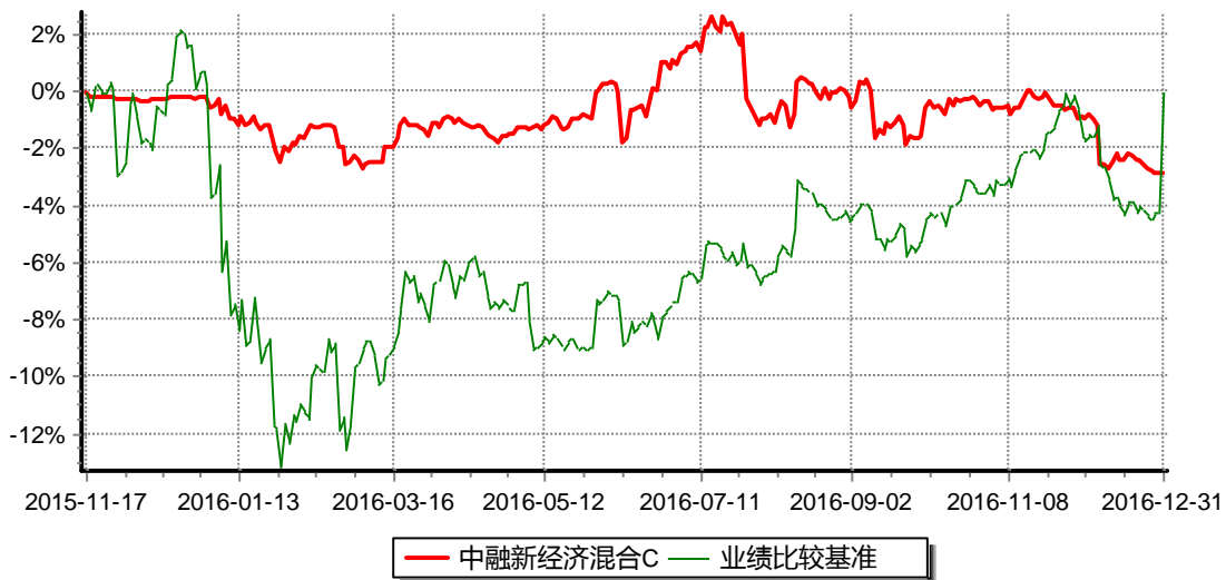
图：中融新经济混合C累计净值增长率与同期业绩比较基准收益率的历史走势对比图 (2015年11月17日至2016年12月31日)

注：按照合同和招募说明书的约定，本基金自合同生效日起6个月内为建仓期，建仓期结束时本基金的各项资产配置比例符合基金合同的有关约定。